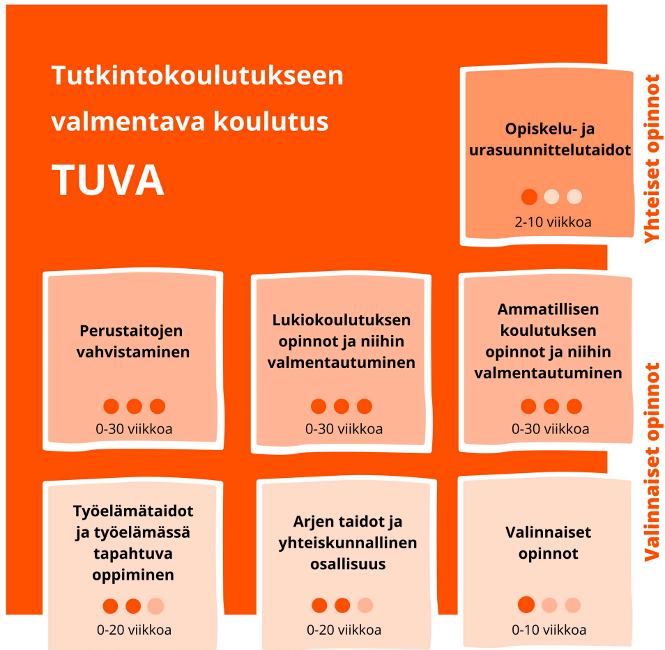
Tutkintokoulutukseen valmentavan koulutuksen muodostuminen

Koulutuksen osien laajuudet on ilmoitettu vaihteluvälillä, joiden sisällä koulutus voidaan suunnitella opiskelijoiden tarpeiden mukaisesti. Koulutuksen osien tavoitteet on määritelty laajuudeltaan koulutuksen osan suurimman mahdollisen laajuuden mukaan. Koulutuksen järjestäjä voi laatia niistä pienempiä kokonaisuuksia koulutuksen osan tavoitteiden pohjalta.