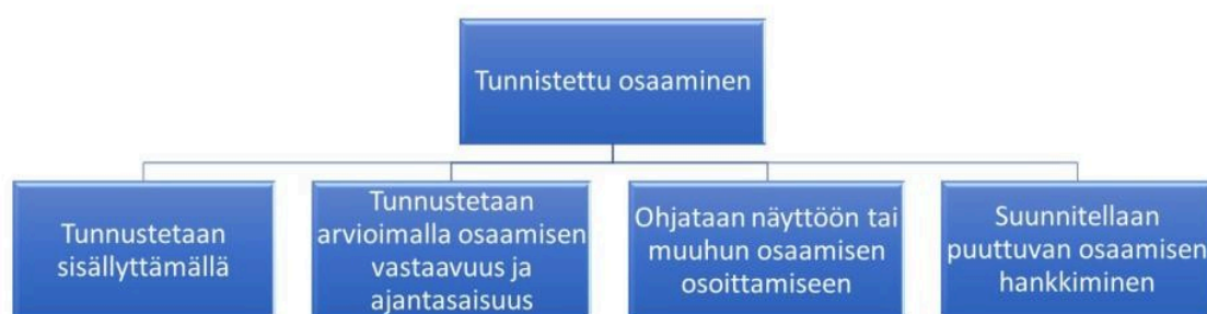
Kuva 1. Osaamisen tunnistamisella ja tunnustamisella vältetään tarpeetonta päällekkäistä koulutusta.

Osaamisen tunnistaminen ja tunnustaminen on koulutuksen järjestäjän tehtävä. Osaamisen tunnistaminen ja tunnustaminen tehdään osana opiskelijan opintojen henkilökohtaistamista.