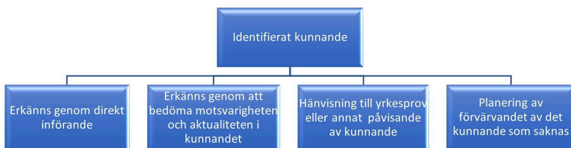
Bild 1. Genom att identifiera och erkänna kunnande undviker man överlappande utbildning.

Det är utbildningsanordnarens uppgift att identifiera och erkänna den studerandes kunnande. Identifieringen och erkännandet av den studerandes kunnande utgör en del av den personliga tillämpningen av studierna.