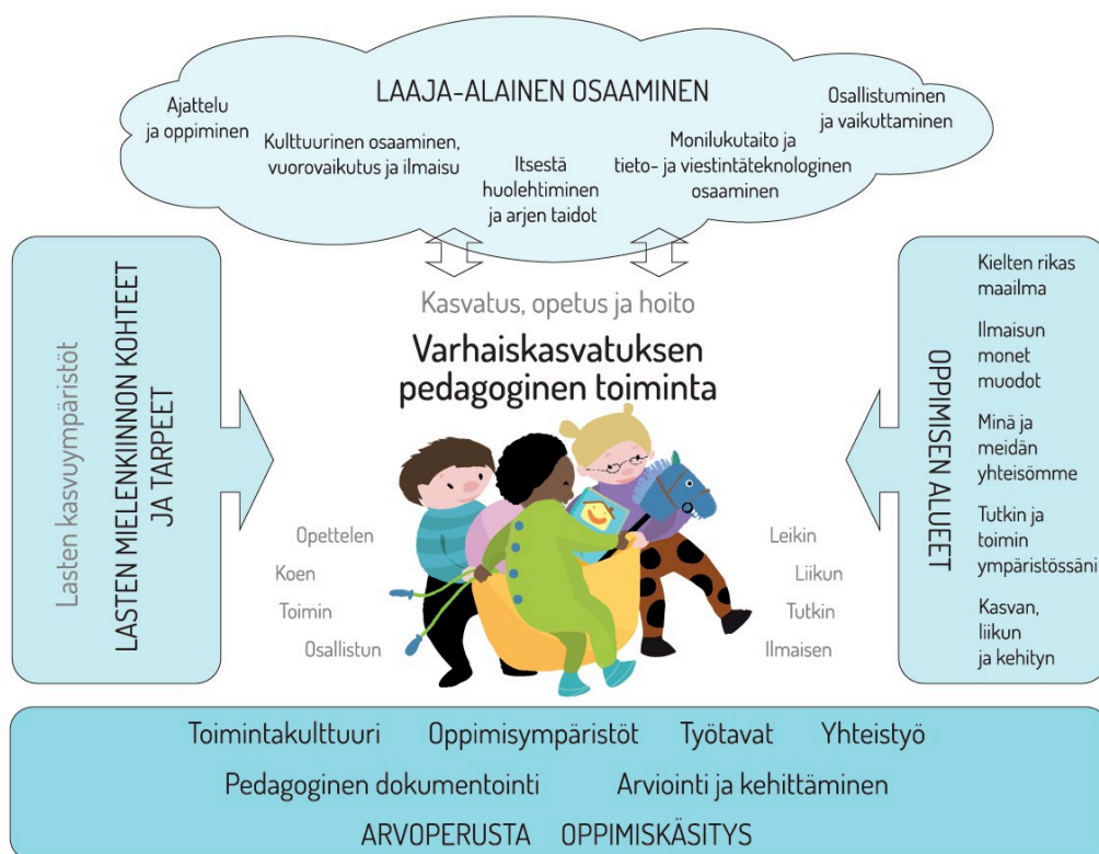
Kuvio 1. Varhaiskasvatuksen pedagogisen toiminnan viitekehys

Varhaiskasvatuksen pedagogista toimintaa ja sen toteuttamista kuvaa kokonaisvaltaisuus. Tavoitteena on edistää lasten oppimista ja hyvinvointia sekä laaja-alaista osaamista (kuvio 1). Pedagoginen toiminta toteutuu lasten ja henkilöstön välisessä vuorovaikutuksessa ja yhteisessä toiminnassa. Lasten omaehtoinen, henkilöstön ja lasten yhdessä ideoima sekä henkilöstön johdolla suunniteltu toiminta täydentävät toisiaan. Varhaiskasvatuksen pedagoginen toiminta läpäisee kasvatuksen, opetuksen ja hoidon kokonaisuuden.