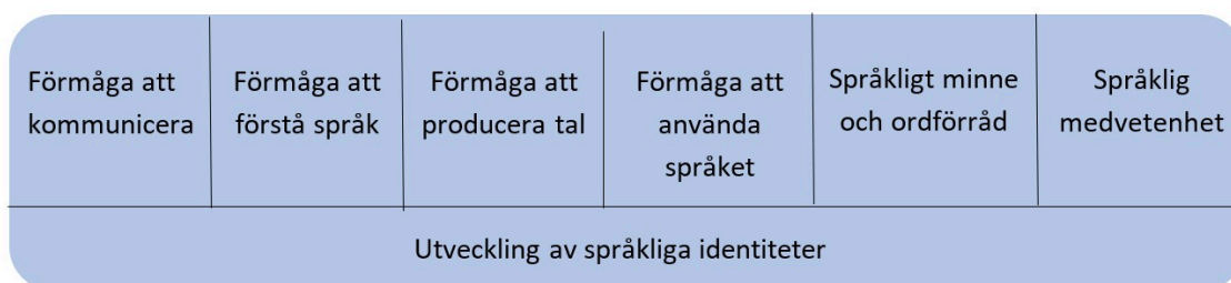
Figur 1. Språkutvecklingens centrala delområden i förskoleundervisningen

Med tanke på språkinläringen är det viktigt att vara medveten om att barn i samma ålder kan befinna sig i olika skeden av språkutvecklingen inom olika delområden. Barnens språkliga identiteter (figur 1) utvecklas när de får stöd och handledning inom de centrala delområdena för språkliga kunskaper och färdigheter.