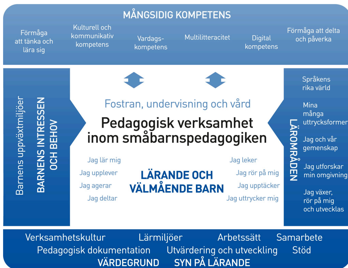
Figur 1. Referensram för den pedagogiska verksamheten

Den pedagogiska verksamheten inom småbarnspedagogiken ska präglas av ett helhetsskapande angreppssätt. Målet är att främja barnens lärande och välbefinnande samt mångsidiga kompetens (figur 1). Den pedagogiska verksamheten förverkligas i samverkan mellan barnen och personalen och i den gemensamma verksamheten. Barnens spontana verksamhet, personalens och barnens gemensamma idéer till verksamhet och verksamhet som planerats av personalen ska komplettera varandra. Den pedagogiska verksamheten inom småbarnspedagogiken ska genomsyra den helhet som består av fostran, undervisning och vård.