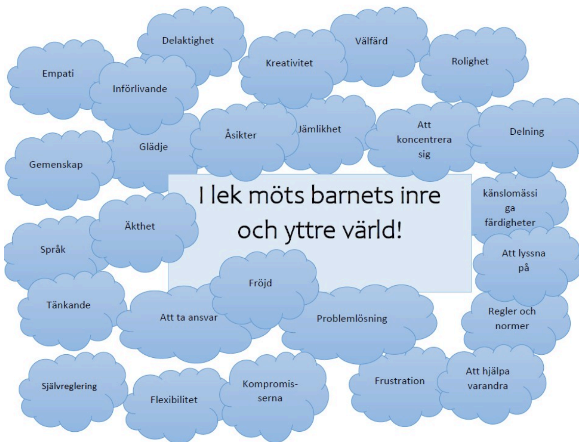
I lek möts barnets inre och yttre värld