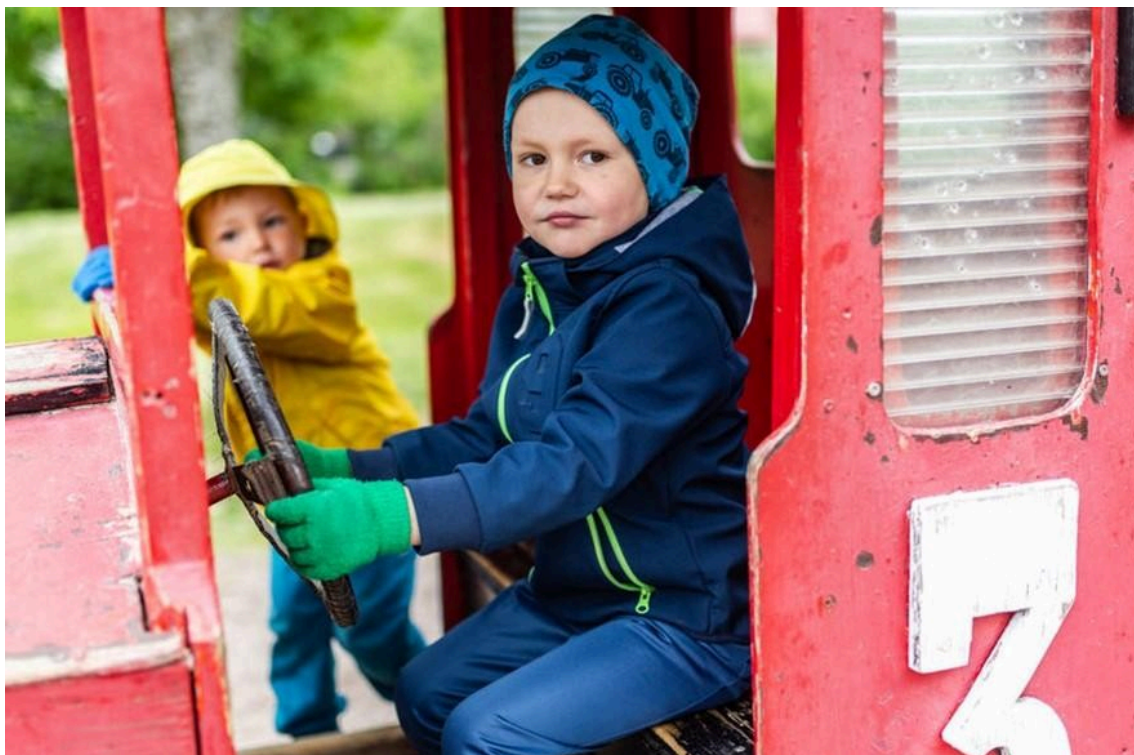
Kaksi lasta leikkii ulkona isossa puuautossa. Toinen lapsi ohjaa ratista leikkiautoa ja toinen seisoo auton oviaukon vieressä.

Lisäksi lapsen varhaiskasvatussuunnitelmaan kirjataan mahdolliset sosiaali- ja terveystalvet, kuten lapsen saama kuntoutus, jos se on olennaista lapsen varhaiskasvatuksen järjestämisen näkökulmasta 131 .