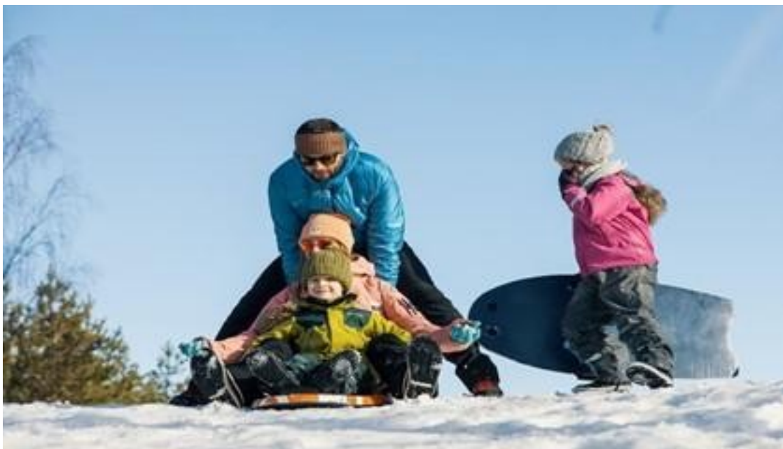
Mies työntää vauhtia kahdelle lapselle mäenlaskussa. Yksi lapsi seisoo takana ja odottaa vuoroa.

osallistuminen varhaiskasvatukseen on usein epäsäännöllistä. Tämä tulee huomioida pedagogisen toiminnan ja lapselle annettavan tuen suunnittelussa ja toteuttamisessa 74 .