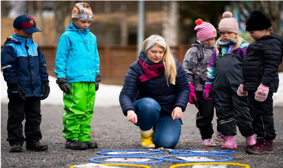
Lapset oppivat ulkona.

Erityiseen tukeen liittyvä hallintopäätöksen 32 laatimisen prosessi paikallisesta näkökulmasta on kuvattu luvussa 5; Tuki varhaiskasvatuksessa.