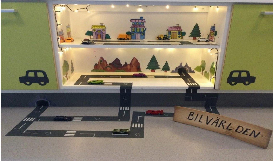
Lattialle ja hyllylle rakennettu leikkipaikka, jossa valaistu autorata.

niihin monenlaisia mahdollisuuksia. Leikkiin kannustavassa oppimisympäristössä myös aikuinen on oppija. Henkilöstö keskustelee leikin merkityksestä ja lasten leikkeihin liittyvistä havainnoista huoltajien kanssa. Tällä tavoin voidaan edistää leikkien jatkumista kotona tai varhaiskasvatuksessa.