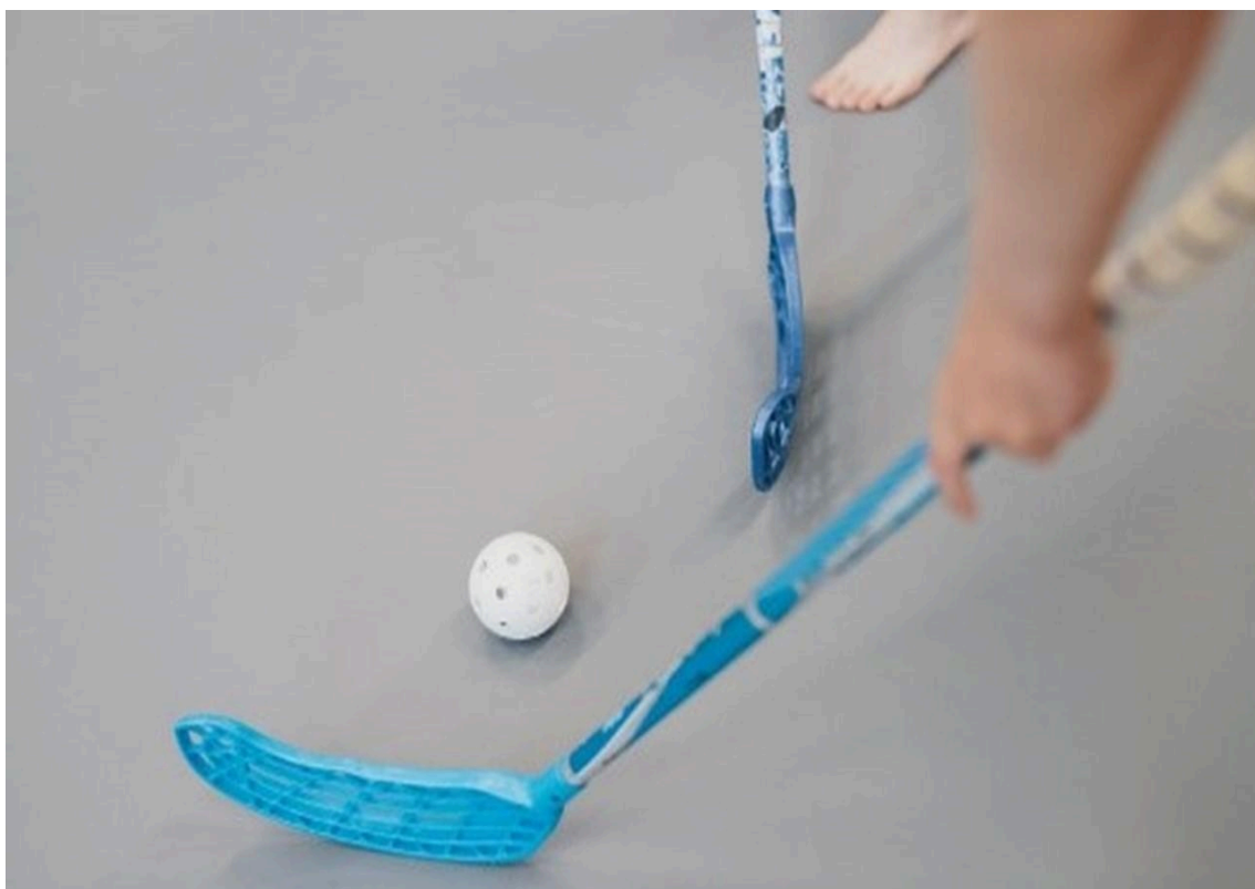
Mailat ja pallo sählypelissä.

antaa heille valmiuksia pyytää ja hakea apua sekä toimia turvallisesti erilaisissa tilanteissa ja ympäristöissä.