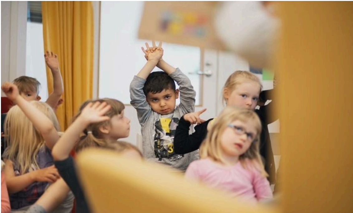
Kuvassa kuusi lasta, joista osa viitta käsipystyssä.