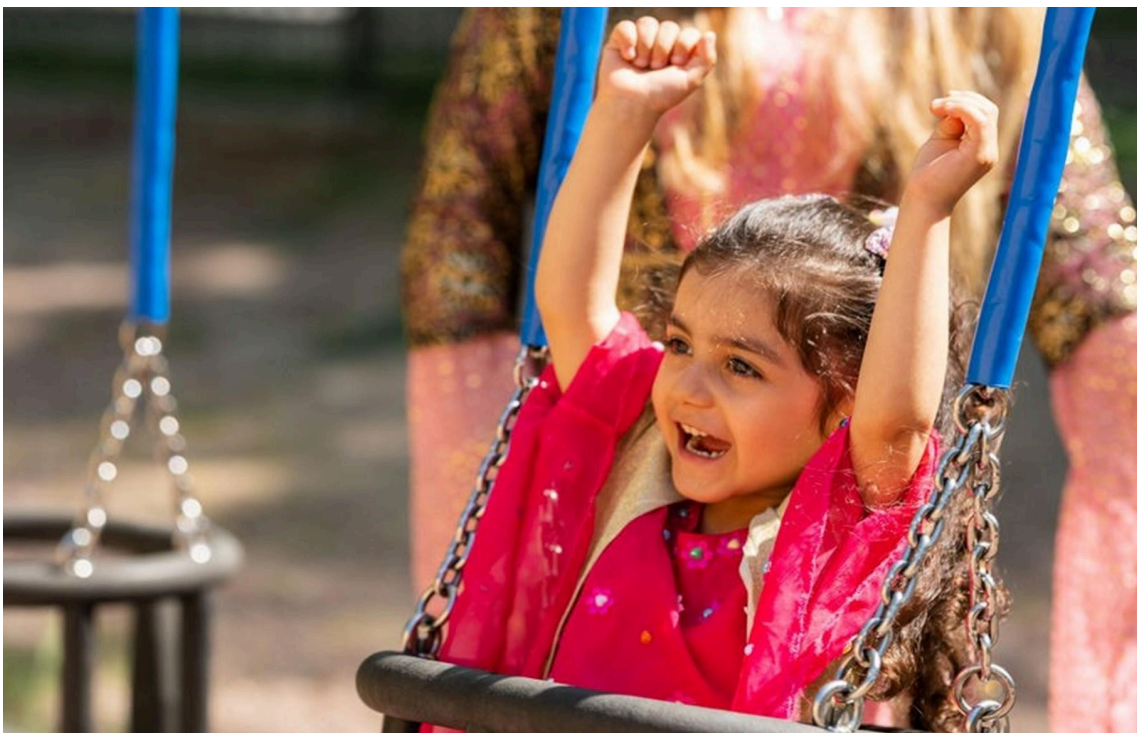
Värikkäisiin vaatteisiin puettu lapsi istuu keinussa. Hänellä on kädet ilmassa.

Lapsille järjestetään mahdollisuuksien mukaan tilaisuuksia käyttää ja omaksua myös omaa äidinkieltään tai omia äidinkieliään. Oma äidinkieli sekä suomen/ruotsin oppiminen toisena kielenä rakentavat pohjaa lasten toiminnalliselle kaksi- ja monikielisyydelle. Vastuu lasten oman äidinkielen tai omien äidinkielen ja kulttuurin säilyttämisestä ja kehittämisestä on ensisijaisesti perheellä. Tarvittaessa huoltajien kanssa käytävissä keskusteluissa käytetään tulkkia, jolla varmistetaan molemminpuolinen ymmärrys.