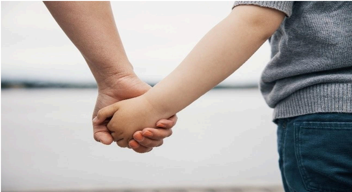
Aikuinen ja lapsi pitävät toisiaan kädestä kiinni. Kuva otettu takaapäin.