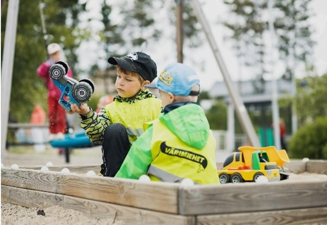
Kaksi lasta hiekkalaatikolla. He leikkivät traktorilla

Varhaiskasvatuksessa mediakasvatuksen tehtävänä on tukea lasten mahdollisuuksia toimia aktiivisesti ja ilmaista itseään yhteisössään. Lasten kanssa tutustutaan eri medioihin ja kokeillaan median tuottamista leikinomaisesti turvallisissa ympäristöissä. Lasten elämään liittyvää mediasisältöä ja sen todenmukaisuutta pohditaan yhdessä lasten kanssa. Samalla harjoitellaan kehittyvää lähde- ja mediakriittisyyttä. Lapsia ohjataan käyttämään mediaa vastuullisesti ottaen huomioon oma ja toisten hyvinvointi. Mediassa esiintyviä teemoja voidaan käsitellä lasten kanssa esimerkiksi liikunnallisissa leikeissä, piirtämällä tai draaman keinoin.