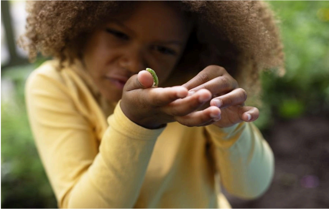
Lapsi tutkii sormellaan olevaa vihreää matoa.

Lasten kanssa havainnoidaan arjessa esiintyviä teknisiä ratkaisuja ja tutustutaan digitaalisiin laitteisiin ja sovelluksiin sekä niiden toimintaan. Erytystä huomiota kiinnitetään koneiden ja laitteiden turvalliseen käyttöön. Lapsille tarjotaan mahdollisuuksia toteuttaa omia ideoitaan esimerkiksi rakennellen eri materiaaleista sekä kokeilla eri laitteiden toimintaa. Lapsia kannustetaan kuvailemaan tekemiään ratkaisuja. Pulmia ratkotaan ja onnistumisista iloitaan yhdessä. Tavoite on, että lasten omakohtaisten kokemusten myötä herää ymmärrys siitä, että teknologia on ihmisen toiminnan aikaansaamaa. Toiminnassa voidaan hyödyntää lähiympäristön teknologisia ratkaisuja, esimerkiksi leluja ja muita arjen teknologisia ratkaisuja, ja tutkia niiden toimintaperiaatteita.