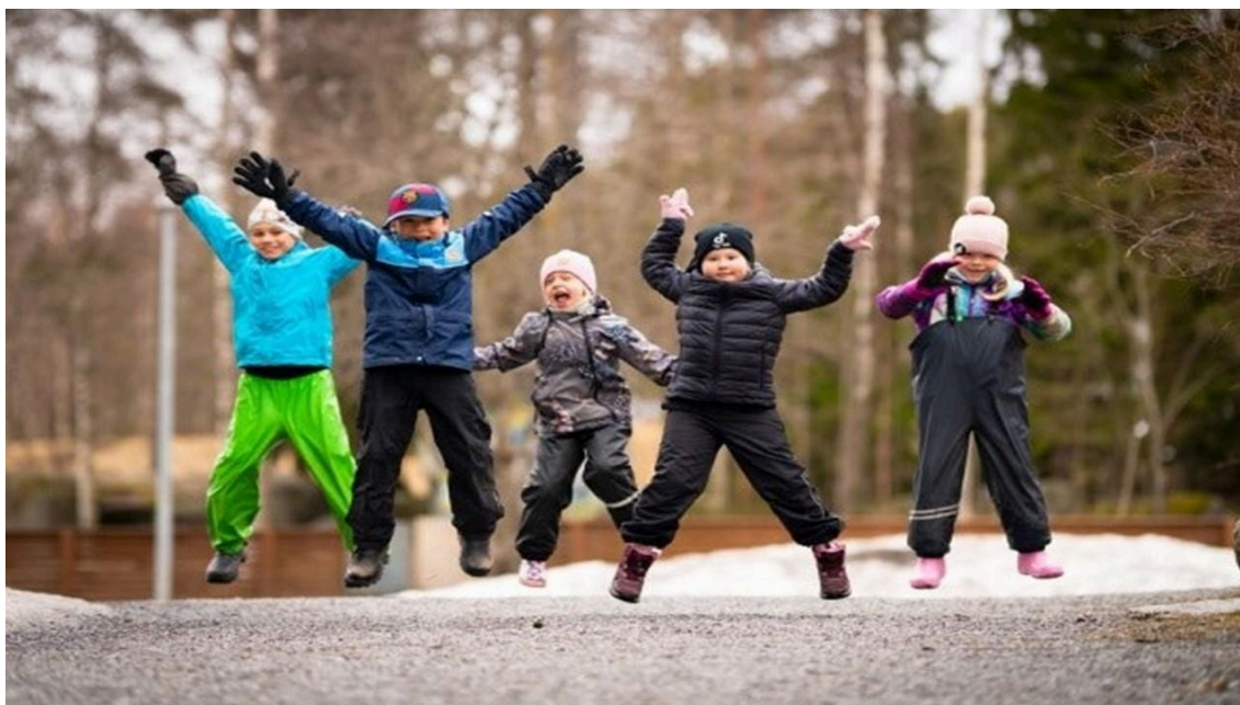
Lapset hyppivät ilmaan ulkona

Lasten arvostava kohtaaminen, heidän ajatustensa kuunteleminen ja aloitteisiin vastaaminen vahvistavat lasten osallistumisen ja vaikuttamisen taitoja. Lapset suunnittelevat, toteuttavat ja arvioivat toimintaa yhdessä henkilöstön kanssa. Samalla lapset oppivat vuorovaikutustaitoja sekä yhteisten sääntöjen, sopimusten ja luottamuksen merkitystä. Henkilöstö huolehtii siitä, että jokaisella lapsella on mahdollisuus osallistua ja vaikuttaa. Osallistumisen ja vaikuttamisen kautta lasten käsitys itsestään kehittyy, itseluottamus kasvaa ja yhteisössä tarvittavat sosiaaliset taidot muovautuvat.