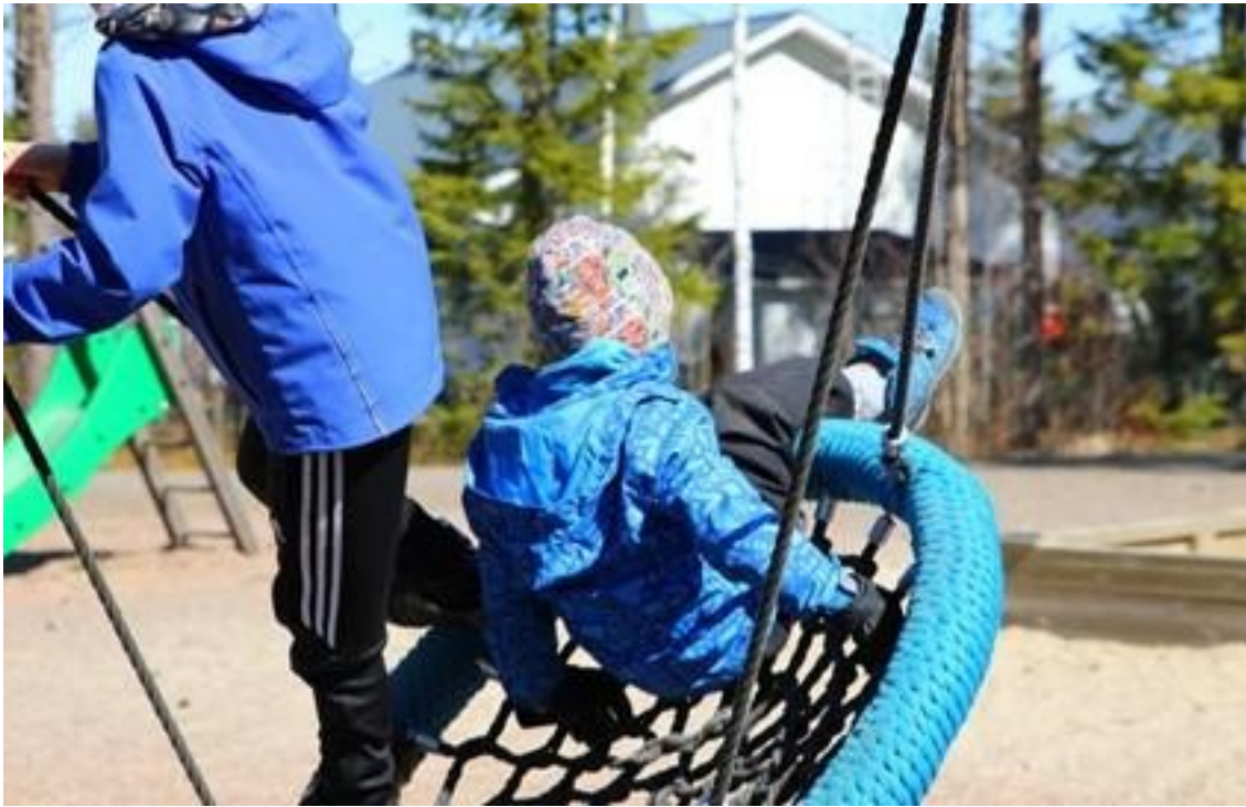
Kaksi lasta keinuu hämähäkkikeinussa.