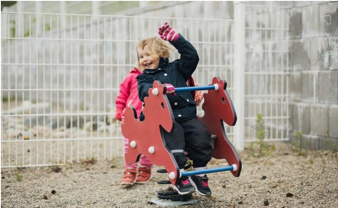
Lapsi istuu pihalla pomppukeinussa. Hän hymyilee ja vilkuttaa toisella kädellä.