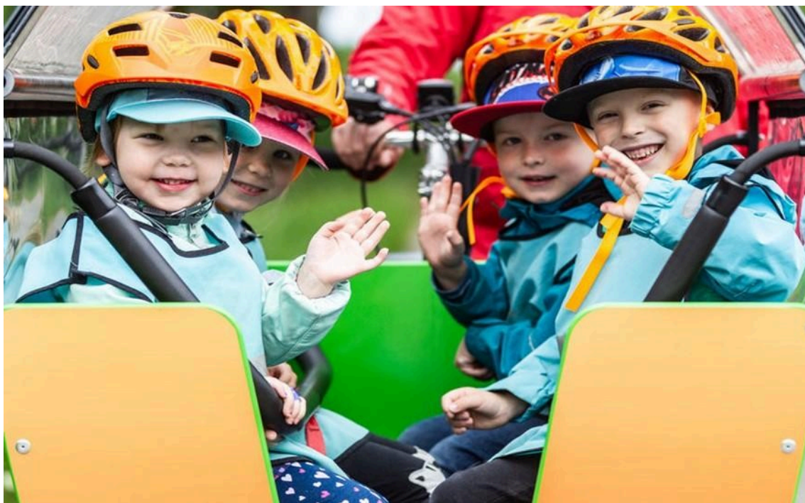
Neljä iloista lasta istuu muksubussin kyydissä. He vilkuttavat.

Henkilöstö täyttää vuosittain osaamiskartoituksen, jonka pohjalta laaditaan kehittämis- ja koulutussuunnitelmat kaikille ammattiryhmille.