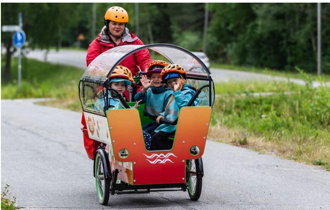
Aikuinen ajaa muksubussia, jonka kyydissä on kolme lasta.

Tuen järjestämisen lähtökohtana ovat lapsen vahvuudet sekä oppimiseen, kehitykseen ja hyvinvointiin liittyvät tarpeet. Lasta kuullaan lapsen ikä ja kehitys huomioiden. Varhaiskasvatuksessa tuki rakentuu lapsen yksilöllisiin tarpeisiin vastaamisesta sekä yhteisöllisistä ja oppimisympäristöihin liittyvistä ratkaisuista. Varhaiskasvatuksessa huolehditaan siitä, että jokainen lapsi kokee itsensä hyväksytyksi omana itsenään sekä ryhmän jäsenenä. Kannustamalla lasta ja antamalla hänelle mahdollisuuksia onnistumisen kokemuksiin tuetaan lapsen myönteisen minäkuvan kehittymistä. Lapsen tarvitsema tuki ja toimenpiteet kirjataan päiväkodissa tai perhepäivähoidossa olevan lapsen varhaiskasvatussuunnitelmaan.