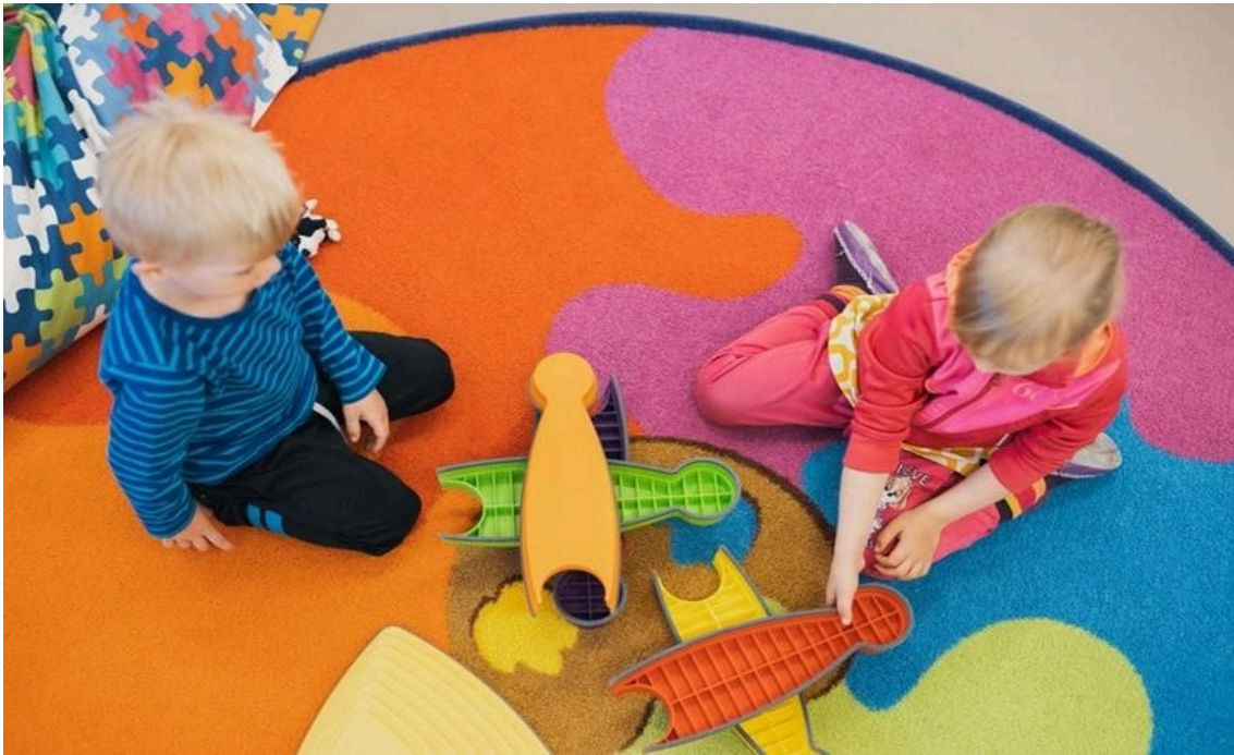
Kaksi lasta rakentelee lattialla isoilla palikoilla värikkään maton päällä.