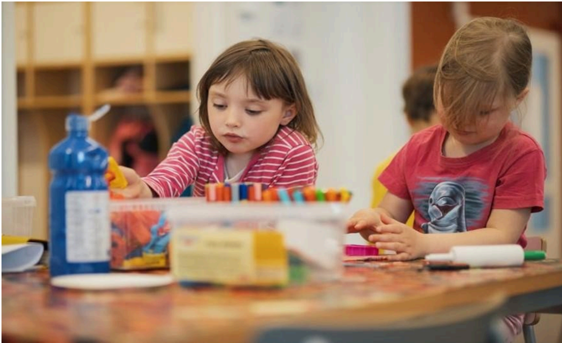
Kaksi lasta istuu pöydän ääressä. He leikkivät muoviluvahalla.