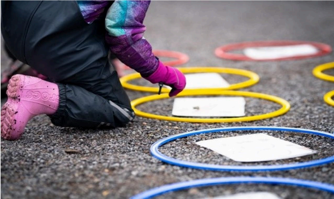
Lapsi on kyykistynyt maahan tekemään tehtäviä.