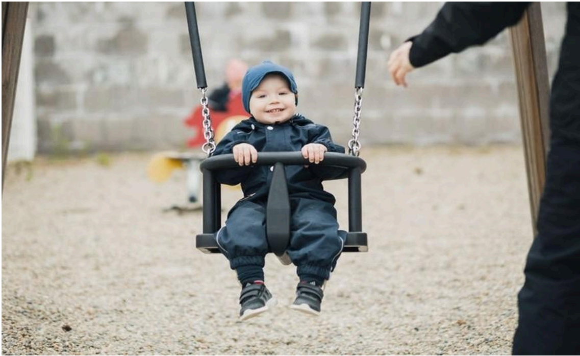
Pieni poika keinuu vauvakeinussa.