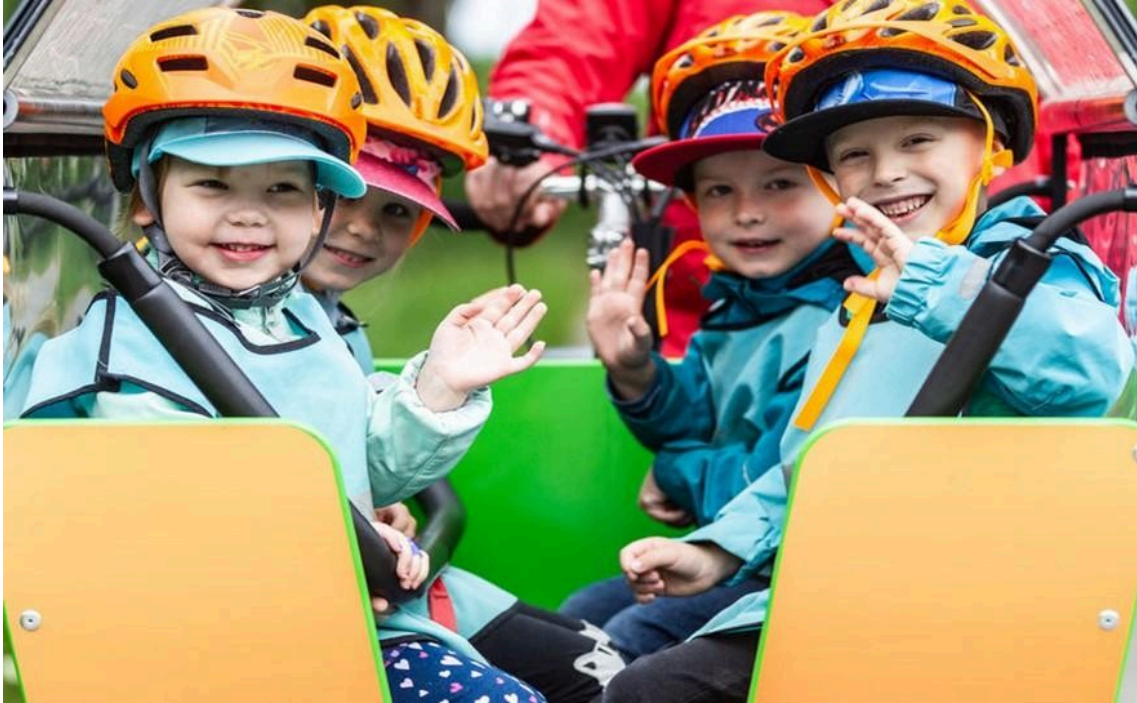
Neljä iloista lasta istuu muksubussin kyydissä. He vilkuttavat.