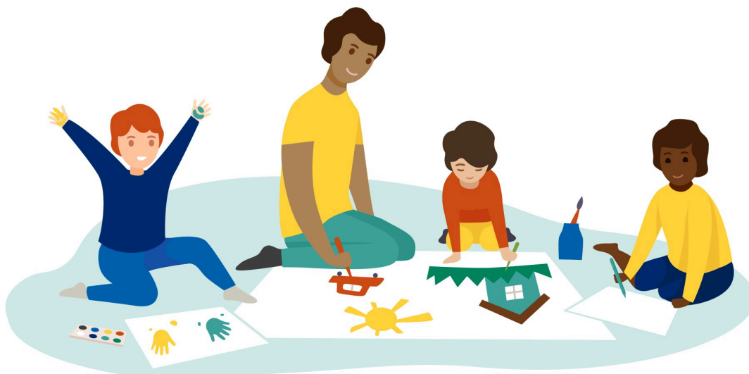
Kolme lasta ja aikuinen piirtävät ja maalaavat