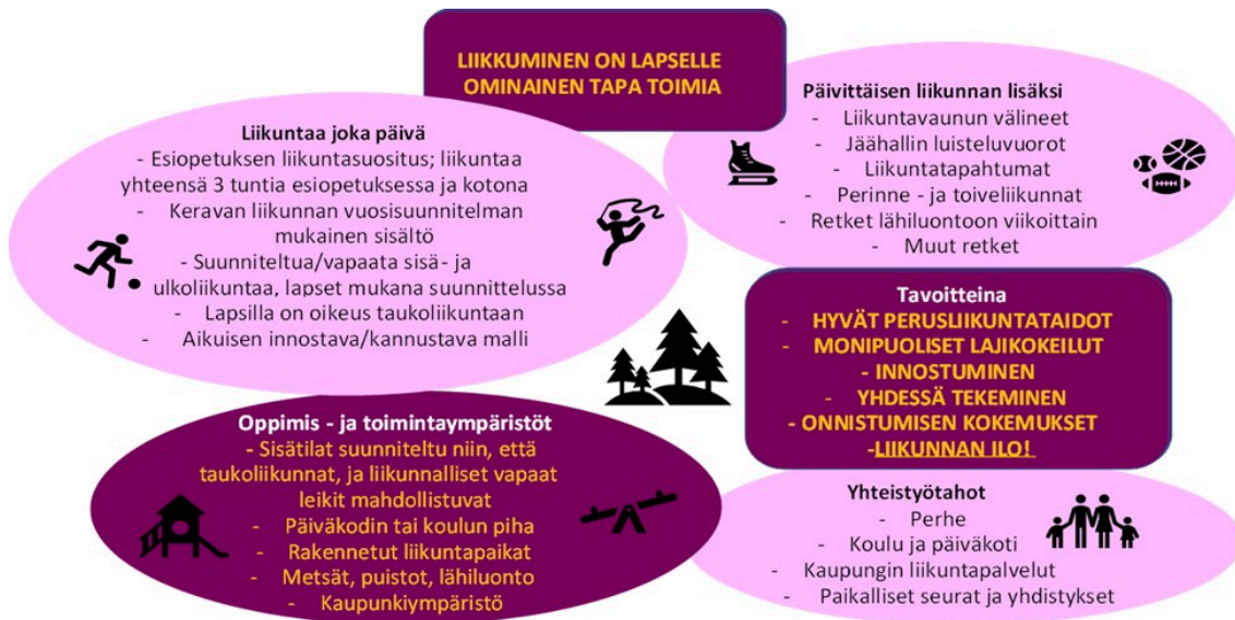
Kuva 4: Liikuntakasvatus Keravalla

Lasten turvallisuudesta huolehditaan, mutta samalla ymmärretään, että liikkumaan oppiminen luo turvallisuutta. Liikkumaan houkutellaan ja lapsen luontaista liikkumisen halua kunnioitetaan ilman, että turvallisuusnäkökulma estää tavallisen tekemisen. Tavoitteena on, että myös pienessä tilassa liikkuminen olisi mahdollista. Aikuisten tehtävänä on huolehtia, että jokainen lapsi saa riittävästi harjoitusta oman kehitysvaiheen mukaan. Liikuntaan ja liikkumiseen motivoimisessa kasvattajien malli on tärkeää. Kasvattajat ovat itse liikkumiseen osallistuvia, innostavia ja kannustavia. Esiopetuksessa korostuu arkiliikunnan ja jokapäiväisen liikunnan merkitys. Liikuntavälineet tulee olla lasten saatavilla omaehtoisien liikunnan lisäämiseksi ja motivoimiseksi. Esiopetuksen henkilöstön tehtävänä on oppimisympäristön muokkaaminen yhdessä lasten kanssa liikuntaan houkuttelevaksi. Keravan esiopetuksessa noudatetaan Keravan varhaiskasvatuksen liikkumisen vuosisuunnitelmaa.