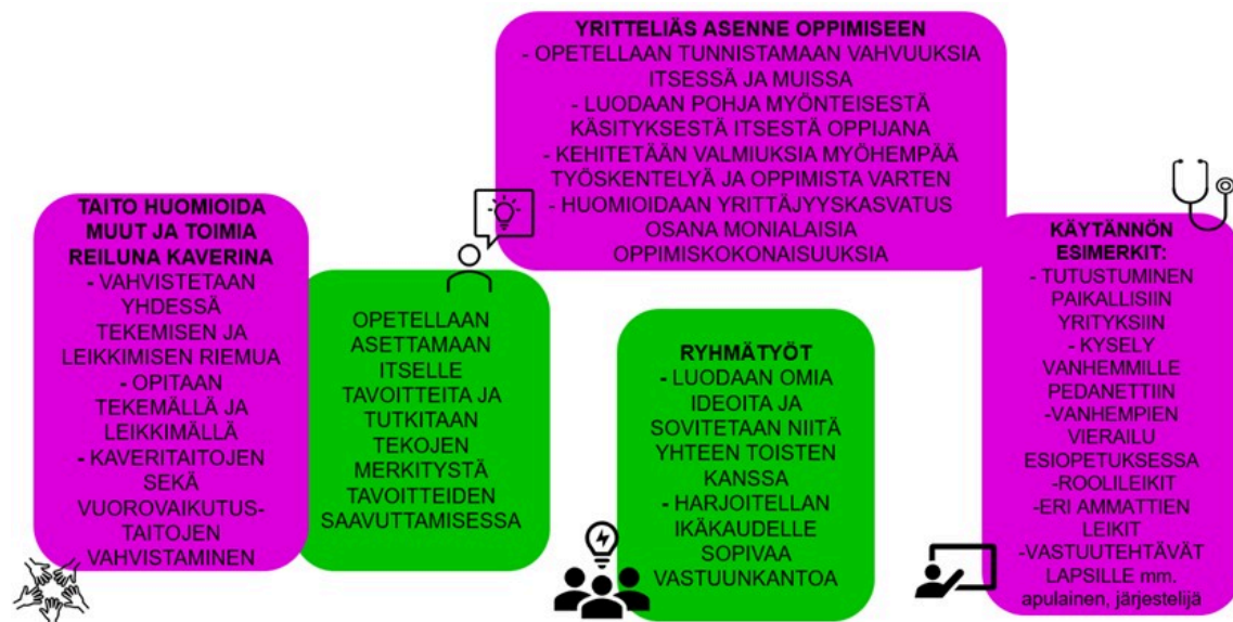
Kuva 3. Yrittäjyyskasvatus esiopetuksessa

Yrittäjyyskasvatuksessa lapsi nähdään aktiivisena toimijana, jonka aikuinen kohtaa valmentavalla työllä. Aikuinen mahdollistaa lapsen uteliaan, rohkean ja tavoitteellisen toiminnan. Lisäksi lasta kannustetaan kokeilemaan rohkeasti uusia asioita ja harjoittelemaan toimintaa muiden kanssa. Lapset opettelevat vahvuksien nimeämistä sekä vahvuksien tunnistamista itsessä sekä toisissa.