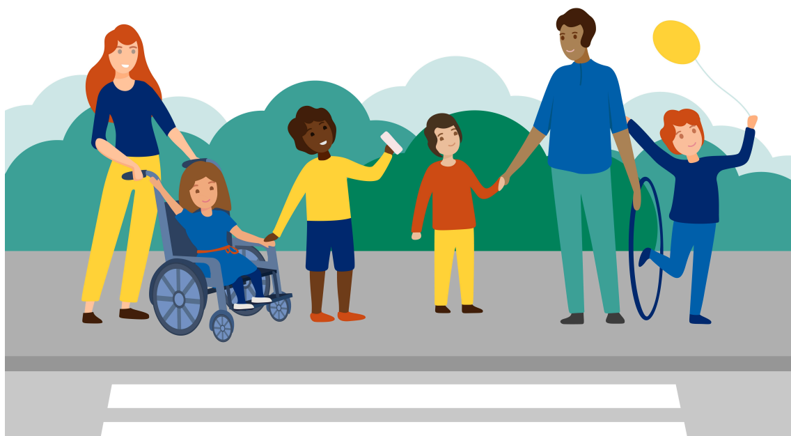
En barngrupp i stadsmiljö

I Åbos förskoleundervisning utgår man från att varje vardaglig situation är ett tillfälle för lärande. Därför bör lärarnas planeringstid användas för pedagogisk planering, utvärdering och utveckling av hela dagens innehåll, snarare än för enskilda undervisningsstunder.