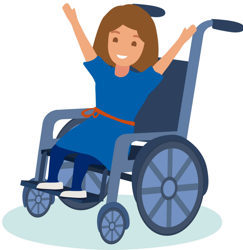
Glatt barn i rullstol

Vid övergångar – till exempel när barnet byter förskolegrupp, flyttar till en ny enhet eller övergår till den grundläggande utbildningen – ansvarar enhetschefen för att relevant information om barnets stödbehov och genomförda åtgärder överförs till den nya verksamheten. En tydlig dokumentation av barnets nuvarande situation och behov i planen för barnspecifikt stöd är därför av stor vikt. Informationsöverföring sker i enlighet med Åbo stads anvisningar.